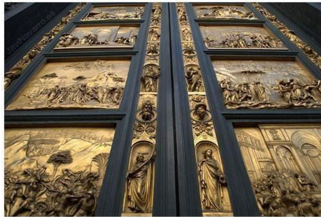
Las Puertas del Paraíso de Lorenzo Ghiberti

En los últimos años del siglo XIV el proto-renacimiento perdió importancia debido a la peste y la Guerra de los Cien Años que sumergieron en una depresión a toda Europa. Las influencias renacentistas no surgieron de nuevo hasta los primeros años del siglo XV. En 1401 el escultor Lorenzo Ghiberti ganó un importante concurso para diseñar un nuevo conjunto de puertas de bronce para el baptisterio de la catedral de Florencia, superando a artistas contemporáneos tales como Brunelleschi o Donatello que más tarde emergió como un maestro de la escultura renacentista.