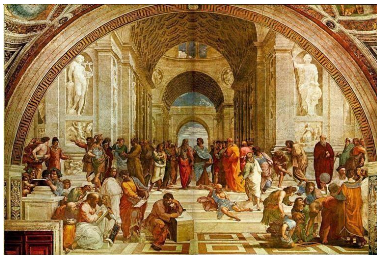
Escuela de Atenas – Rafael Sanzio

A continuación, destacamos algunas de las características más importantes de la pintura del Renacimiento así como los artistas más destacados.