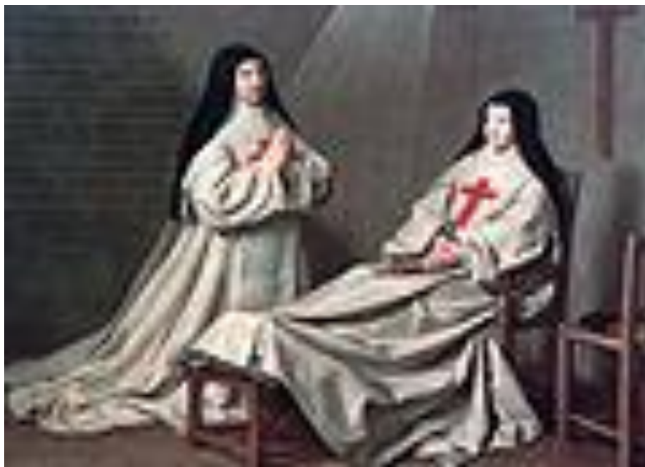
Retrato de la Madre Arnould y de la hija del pintor. Exvoto, Philippe de Champaigne, 1662, Museo del Louvre, París.

Se reprodujeron escenas históricas y mitológicas. El espacio se iba recreando mediante planos sucesivos, sin brusquedades; con las figuras siempre hacia el centro de la composición; no hay violentos contrastes ni actitudes exageradas. Se destacan las obras de los italianos Carracci, Reni y Lanfranco, y de los franceses David e Ingres.