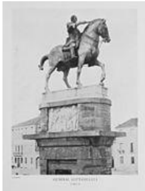
El condottiero Gattamelata, de Donatello.

Laocoonte y sus hijos, el formidable drama helenístico de la escuela de Rodas descubierto en 1506 en la misma Roma, el Apolo del Belvedere y el Torso del Belvedere, que tanto admiraba Miguel Angel, la Venus Calipigia y muchos mármoles y bronce alumbrados por la arqueología, contribuyeron a insuflar lecciones de clasicismo, aunque fuera muy parcialmente por ausencia de otros modelos, que se extendieron a lo largo del siglo.