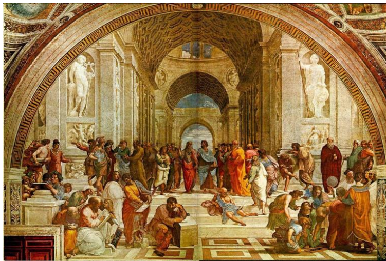
Escuela de Atenas – Rafael Sanzio

A continuación, destacamos algunas de las características más importantes de la pintura del Renacimiento así como los artistas más destacados.