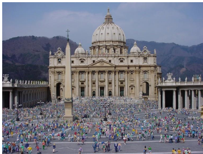
Basílica de San Pedro Ciudad del Vaticano

A continuación destacamos algunas de las características más importantes de la arquitectura del Renacimiento así como los arquitectos más destacados.