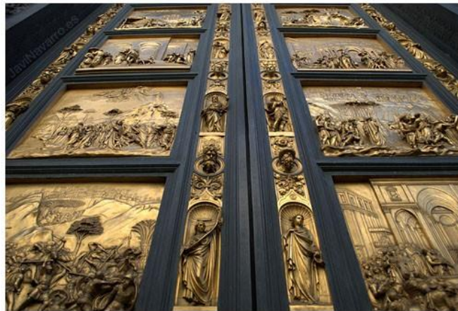
Las Puertas del Paraíso de Lorenzo Ghiberti

En los últimos años del siglo XIV el proto-renacimiento perdió importancia debido a la peste y la Guerra de los Cien Años que sumergieron en una depresión a toda Europa. Las influencias renacentistas no surgieron de nuevo hasta los primeros años del siglo XV. En 1401 el escultor Lorenzo Ghiberti ganó un importante concurso para diseñar un nuevo conjunto de puertas de bronce para el baptisterio de la catedral de Florencia, superando a artistas contemporáneos tales como Brunelleschi o Donatello que más tarde emergió como un maestro de la escultura renacentista.