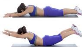
Ejercicio 7: 20" superman (mantener postura)