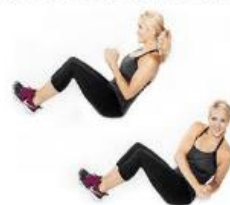
Ejercicio 4: 20 x twist de cintura