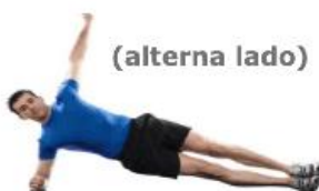
Ejercicio 2: 30" plancha lateral (alterna lado)