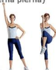
Ejercicio 6: 20 x codo a rodilla (alterna pierna)