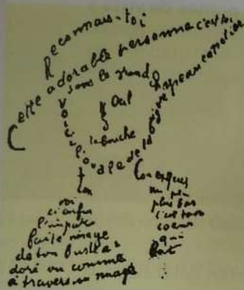
El poeta francés Guillaume Apollinaire (1880-1918) fue famoso gracias a sus complejos caligramas.