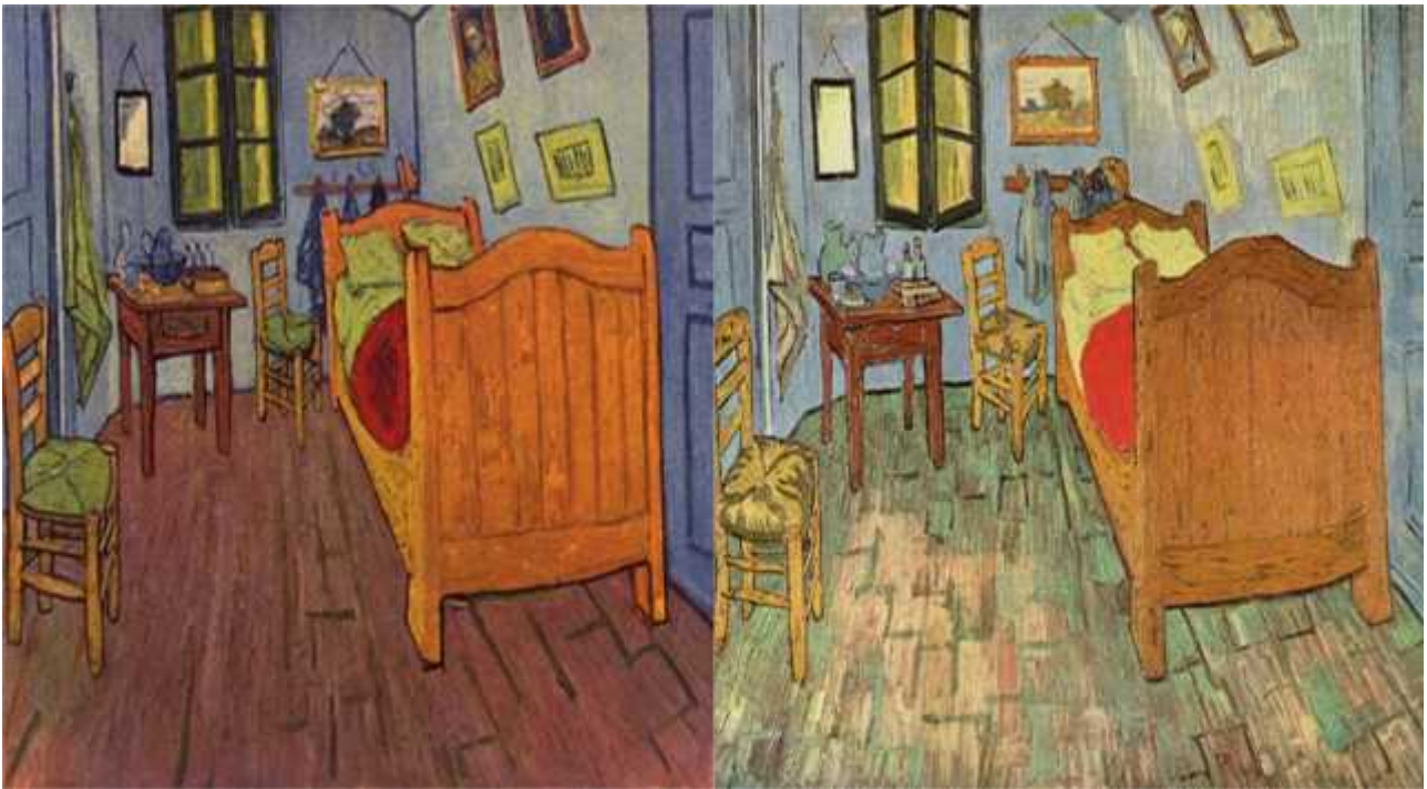
Primera versión, 1888