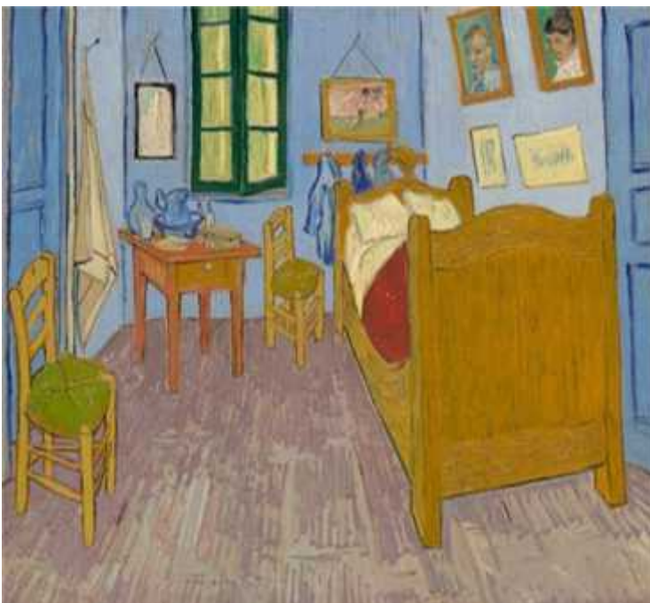
Tercera versión, 1889