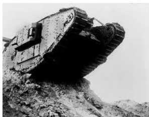
Tanques de guerra