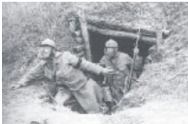
Guerra de Trincheras.