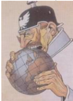
Guillermo II devorando El mundo.