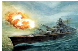
Acorazado de Bismarck