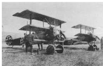
Aviones de guerra